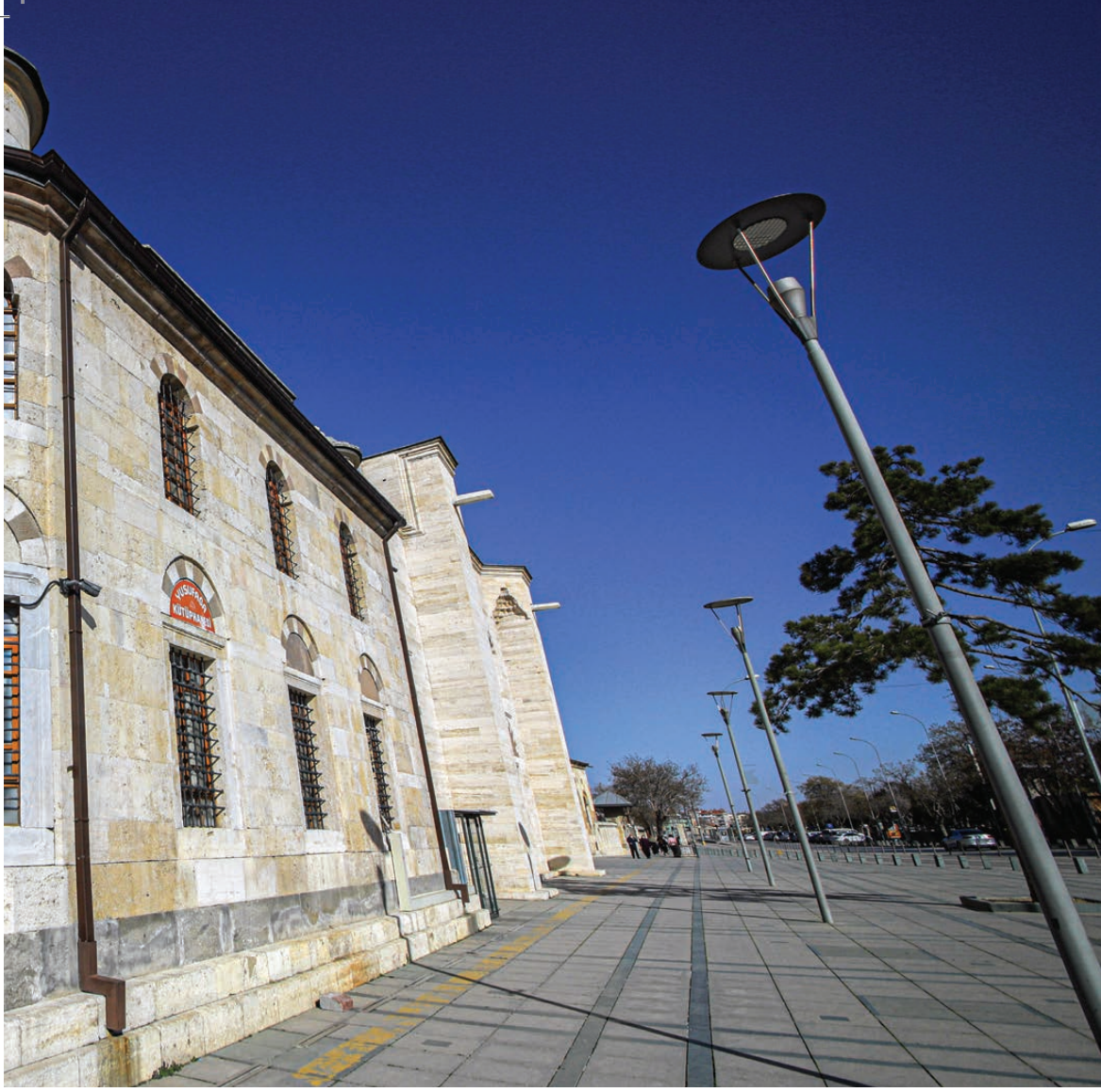
Yusuf Ağa Kütüphanesi

tağış yapılması, “yüzlük”, yani iki buçuk kuruşluk basılması kararı alınmıştır. 6 Eylül 1789’da Yusuf Ağa’nın yönetimindeki Darphane ilk yüzlükleri basmaya başladı. Bu hamleyle kuruşun gümüş içeriği 1,2 gram daha azaltılmış oluyordu. Gerekli altın ve gümüşün temini için daha önce ikişerlik basılırken yapıldığı gibi bir kampanya düzenlenmiş, Darphane’ye düşük kurdan altın ve gümüş getirilmesi için fermanlar yayınlanmıştı. Cihat zamanında altın ve gümüş kullanımının